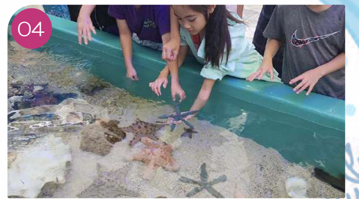
04 タッチプールでサンゴや海の生き物に触れ合ってくださいます。