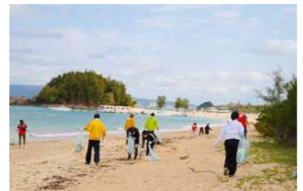
Regular beach cleanup activities in cooperation with local residents and cooperating organizations.