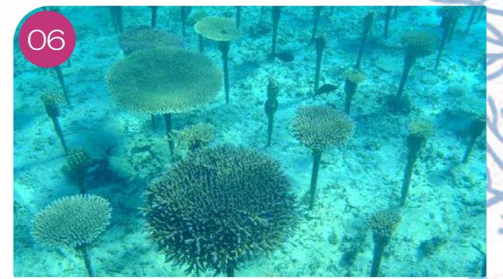
06 The planted corals will continue to be observed and environmentally surveyed on a regular basis to monitor their growth.