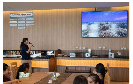
Holding coral workshop (educational program on marine environmental issues)