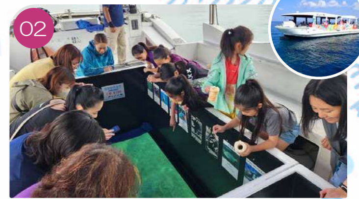
02 Glass boat (pleasure boat): We will have a look and feel at the current state of the sea and think about making and planting seedlings.