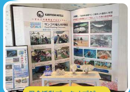
保全活動ブックオブジェ