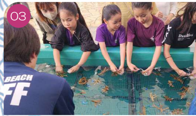
03 After the lectures, participants will make seedlings using coral and sticks.