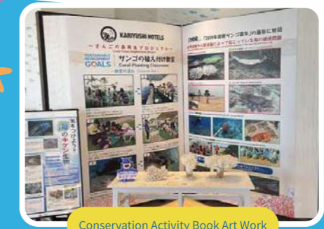
Conservation Activity Book Art Work

Enjoy learning about coral conservation activities and marine life by seeing, reading, and touching them!