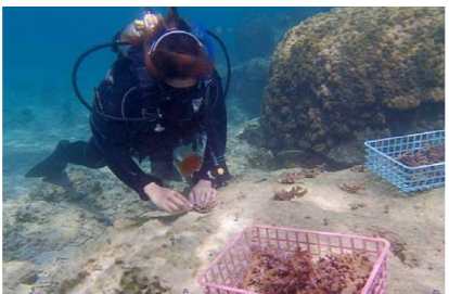
Planting coral seedlings in cooperation with Onna Village Fisheries Cooperative Association.