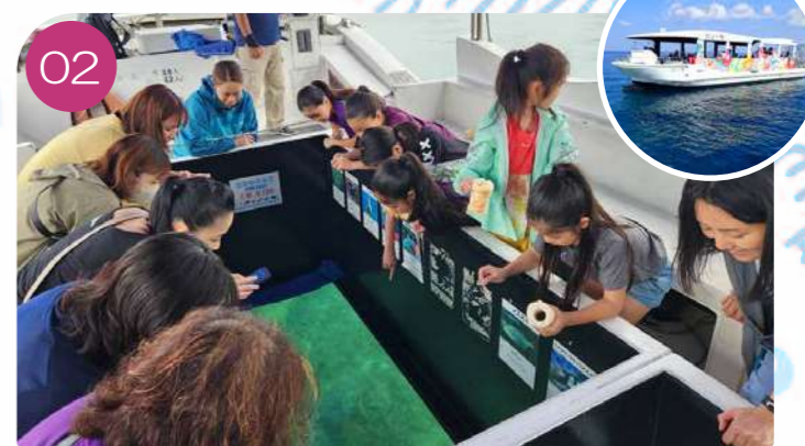
02 グラスボート（鑑賞遊覧船）海の現状を見て・感じていただき、苗作り・植え付け体験について考えます。