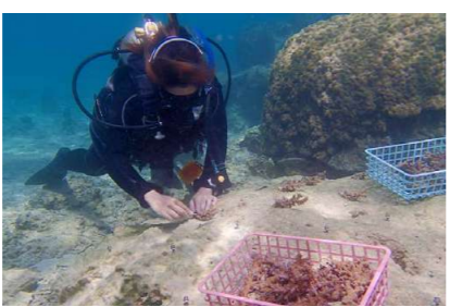
恩納村漁業協同組合と連携したサンゴ苗の植え付け