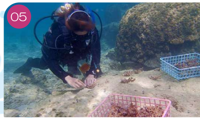
05 The coral seedlings will be planted at a later date in cooperation with the Onna Village Fisheries Cooperative Association.