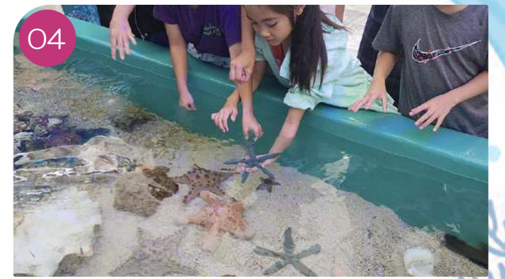
04 Visitors are invited to touch coral and other sea creatures in the touch pool.