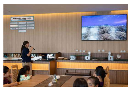
サンゴ教室の開催（海洋環境問題の啓発プログラム）