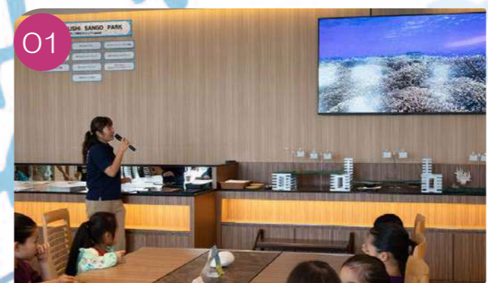
01 サンゴの生態やサンゴ礁の危機状況などの海洋環境講習をうけます。