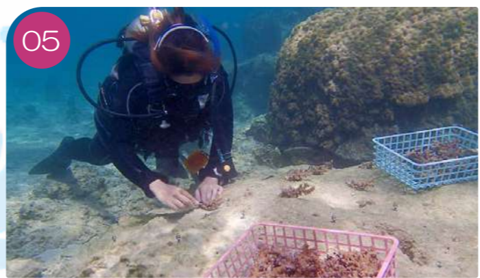
05 作ったサンゴの苗は、後日恩納村漁業協同組合の協力により植え付け作業を実地いたします。