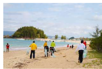
地域の方々や協力団体と連携によるビーチクリーンアップ定期的に活動