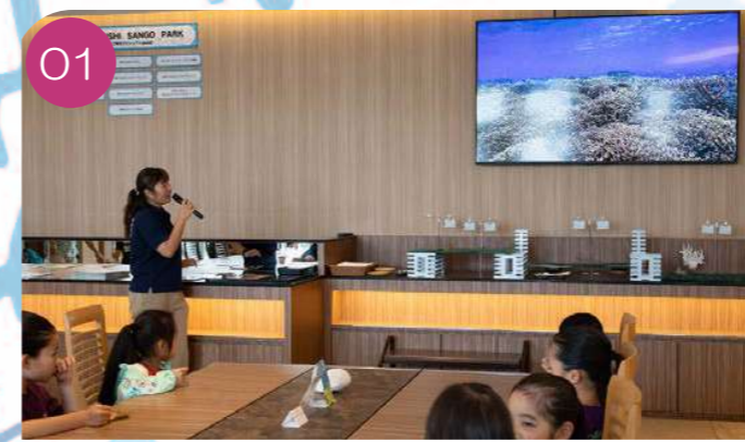
01 Participants will receive lectures on the marine environment, including coral ecology and the critical status of coral reefs.

Kariyushi "Sango Park" in Kariyushi Beach offers "Coral Workshop".