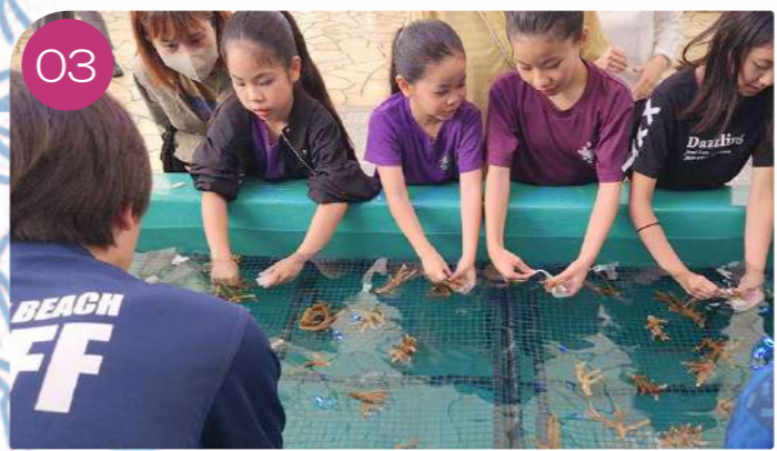
03 講習後はサンゴとスティックなどを使って苗作りを体験していただきます。