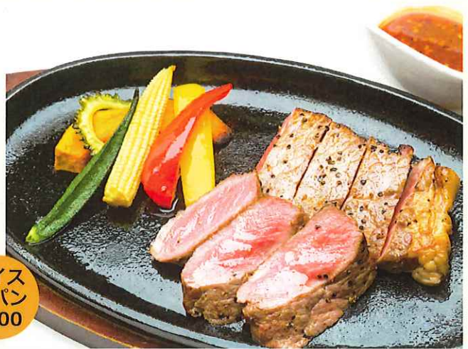
特選牛サーロインステーキ ¥2,700