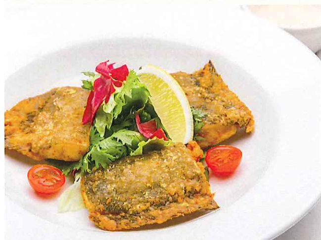
魚のフリット マヨネーズチリソース