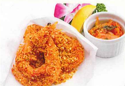
スパイシーシュリンプ ¥900