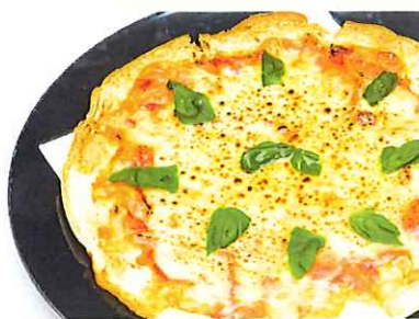
ピッツァマルゲリータ (トマトバジルピザ)