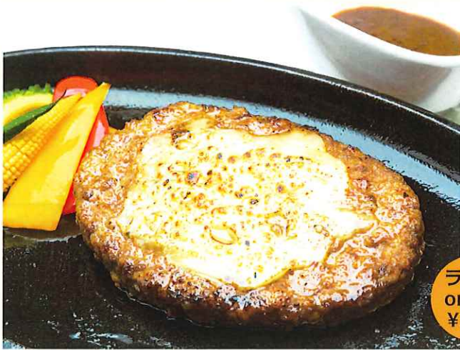
沖縄県産黒毛和牛のチーズハンバーグステーキ ¥1,500