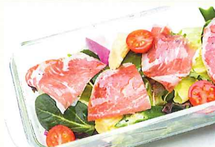
生ハムと彩り野菜の南国サラダ ¥750