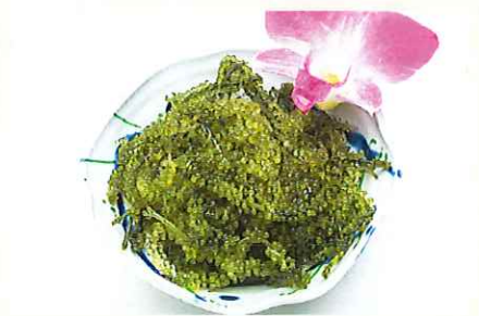
地元恩納村の海で採れた ぷちぷち海ぶどう ¥800