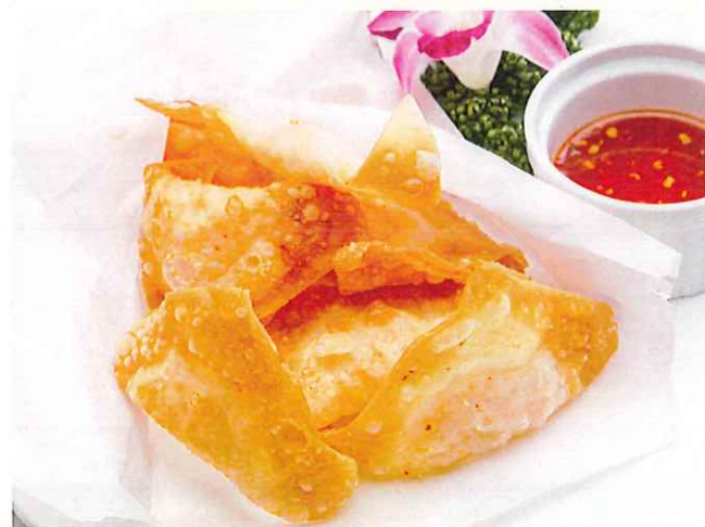
揚げワンタンスイートチリ