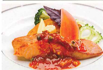
サーモンのオープン焼き ケツカソース