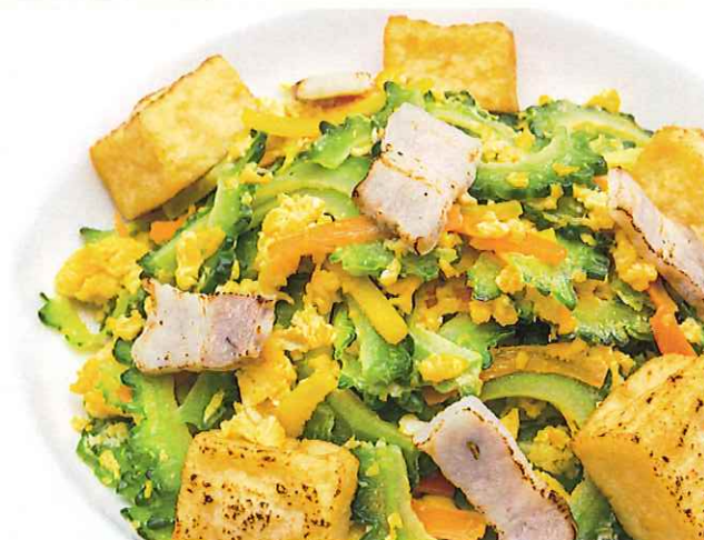
ゴーヤーチャンプルー