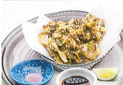
恩納村産もずく天ぷら 紅芋塩を添えて