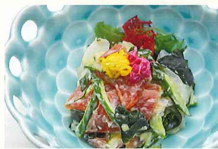
鮮魚の酢味噌和え シークァーサー風味 ¥800