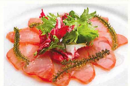
マグロスモークのカルパッチョ ¥750