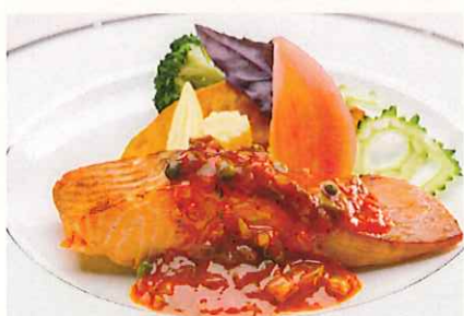
サーモンのオープン焼き ケッカソース