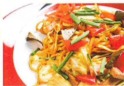
うちなー焼きそば