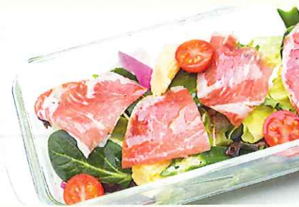
生ハムと彩り野菜の南国サラダ ¥750