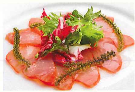
マグロスモークのカルパッチョ ¥750