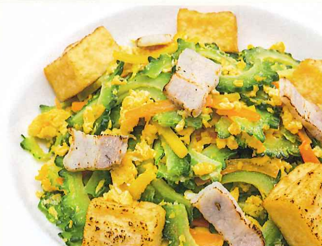
ゴーヤーチャンプルー