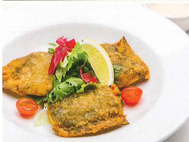
魚のフリット マヨネーズチリソース