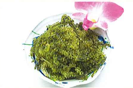
地元恩納村の海で採れた ぷちぷち海ぶどう ¥800