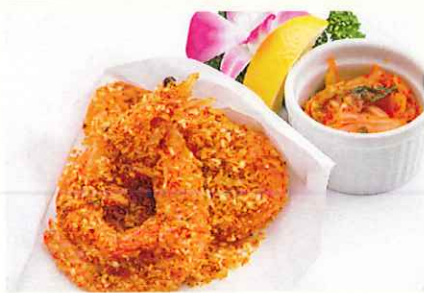
スパイシーシュリンプ ¥900