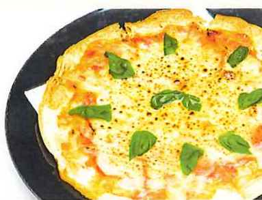
ピッツァマルゲリータ (トマトバジルピザ)