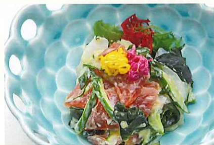
鮮魚の酢味噌和え シークァーサー風味 ¥800