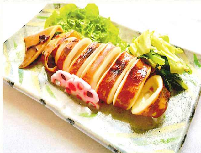
イカの照り焼き ヒハツ(島胡椒)風味