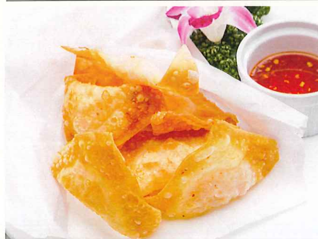
揚げワンタンスイートチリ