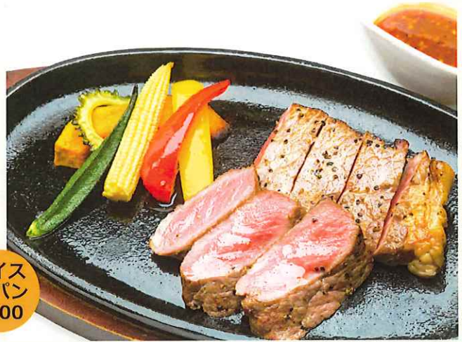
特選牛サーロインステーキ ¥2,700