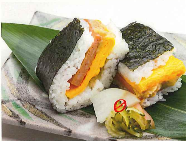
ポーク玉子おにぎりと自家製漬物 ¥600