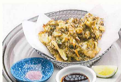
恩納村産もずく天ぷら 紅芋塩を添えて