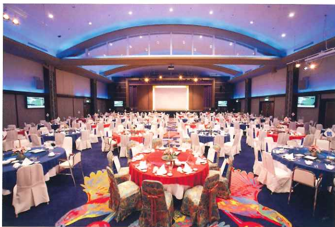
ニライカナイの間